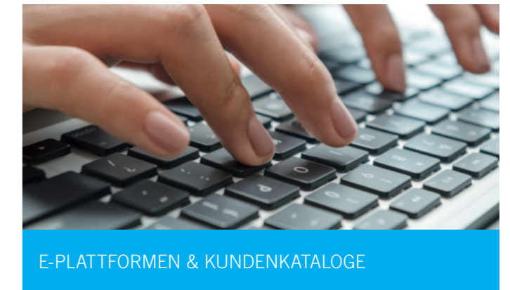
E-PLATTFORMEN & KUNDENKATALOGE

Zunehmende Nachfrage besteht nach elektronischen Anbindungen, bei dem das ERP des Kunden direkt mit dem ERP von Maagtechnic verbunden wird. Mit dieser integrativen Lösung können Prozesskosten, -geschwindigkeit, -sicherheit und -transparenz wesentlich verbessert und rationalisiert werden. Die EDI-Lösung kann dabei flexibel auf die Bedürfnisse des Kunden angepasst werden. Ein Beispiel ist unter anderem die E-Rechnungsfunktion. Maagtechnic arbeitet mit den gängigen technischen Standards auf dem Markt.