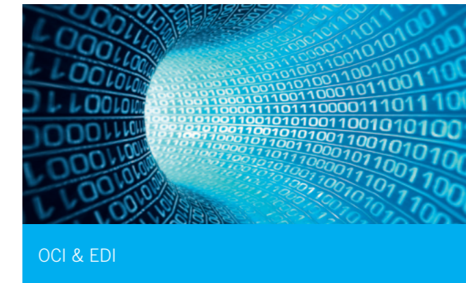
OCI & EDI

Der Handschanner ermöglicht es Ihnen, Bestellungen und Merklisten anzulegen. Diese werden über eine Schnittstelle von Ihrem Computer automatisch in den Maagtechnic-Warenkorb gelegt. Die Barcode-Etiketten generieren Sie für die gewünschten Artikel und Sortimente selber. Im Maagtechnic-Warenkorb kontrollieren Sie die Bestellung und schliessen diese ab. Damit optimieren sie Ihren Bestellprozess und erzielen eine kosteneffiziente Warenbewirtschaftung.